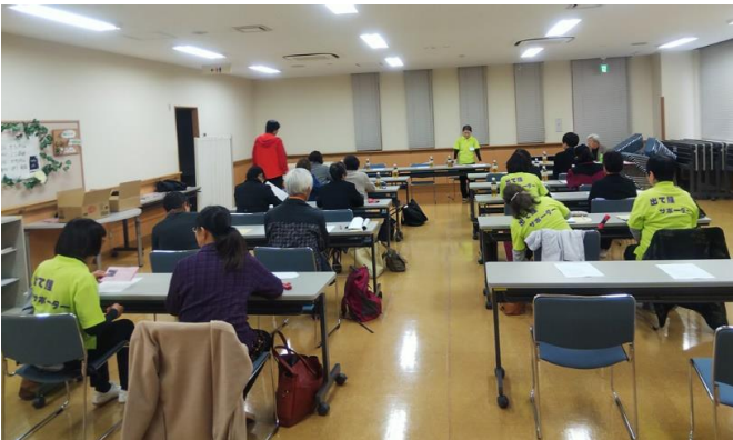
工藤代表あいさつ

なお、NPO法人佐久平総合リハビリセンターへは団体会員として会で会費を納入します。