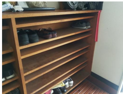
(下駄箱への下足札と靴)