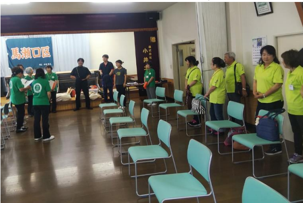
(朝のスタッフミーティング)

7月3日(水)NPO法人御代田町はつらつサポーターが行っているB事業を視察研修しました。日程は、9:00からのスタッフ打合せ、9:30頃からの利用者の受け入れ、10:00からの事業の全体の流れ、送迎状況、終了後の町の職員(町と包括)と千葉県松戸市の「元気応援くらぶ」の皆さんとの意見交流会に参加しました。出て鯉サポーターの参加者は9名でした。