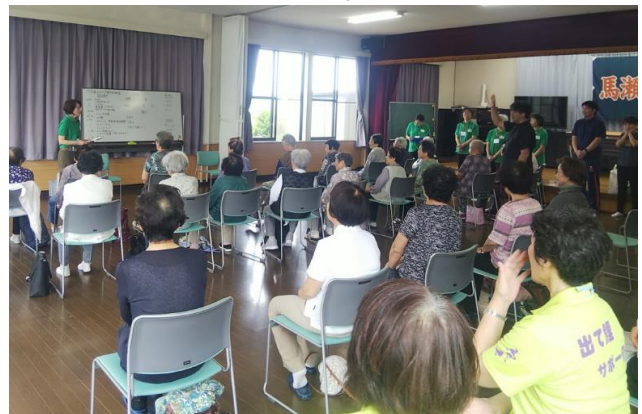
(開会セレモニーの状況)

B事業の日程は、①開会、痛みのチェック、準備体操(ふるさと体操、指体操(ふるさと)、歌唱体操(見上げてごらん夜の星を)を10:00～10:20、②ストレッチ体操を～10:50、途中で水分補給、③サザエさん体操、サーキットタイム(アイテムのタオルと棒)、ナツメロコーナーを11:00～11:45 ④タオル体操チェック(自宅での体操時の指導)、パタカラ体操+歌(七夕)11:45～12:00終了。