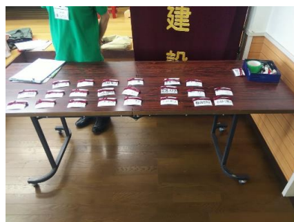
(会場入口での名札)

玄関には下足札と履き替えのためのイス。下駄箱には下足札と靴を置いて間違い予防。会場入口では名札を見えやすく置き、自分で取って、自ら下げる。利用者の自主性を重んじている。